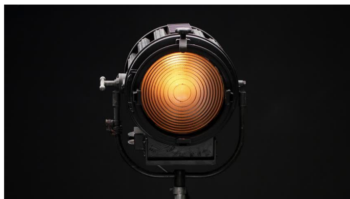
Spot an fürs Theaterlabor!

Dich interessiert dieses Angebot und du möchtest es für deine Berufsschule adaptieren? Setze dich gerne mit mir in Kontakt: ✉ hallo[at]kulturmoehre.de