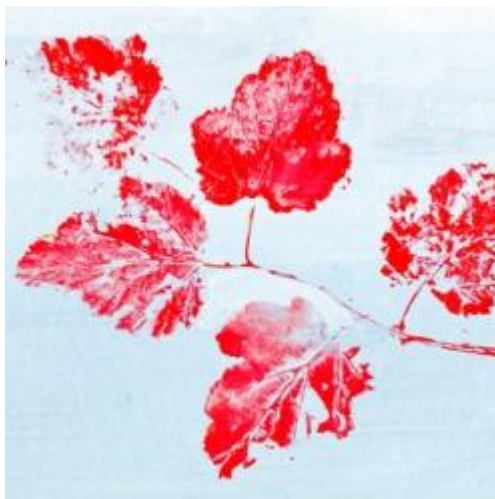
Beispielkunstwerke aus dem Workshop