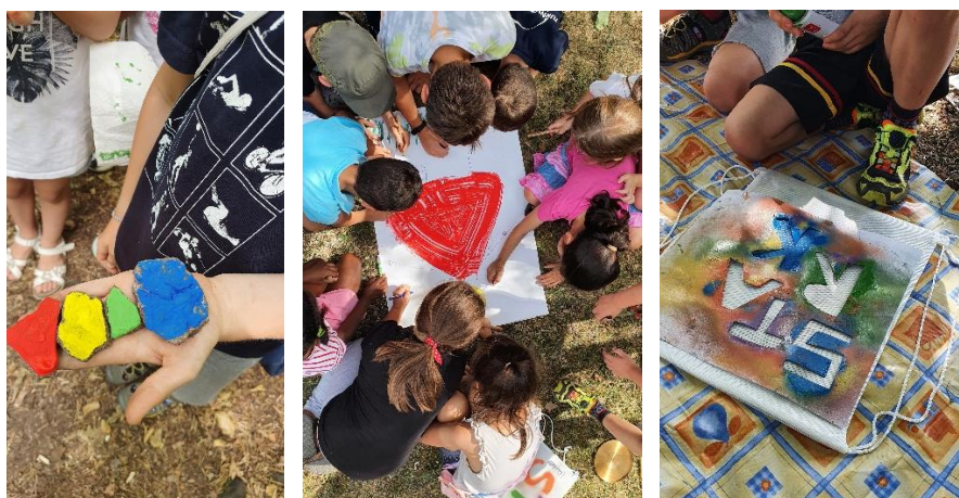
Eindrücke vom Erlebnistag

Dauer: 6 Stunden oder 2x3 Stunden (zzgl. Zeit für Mittagessen und Pausen)