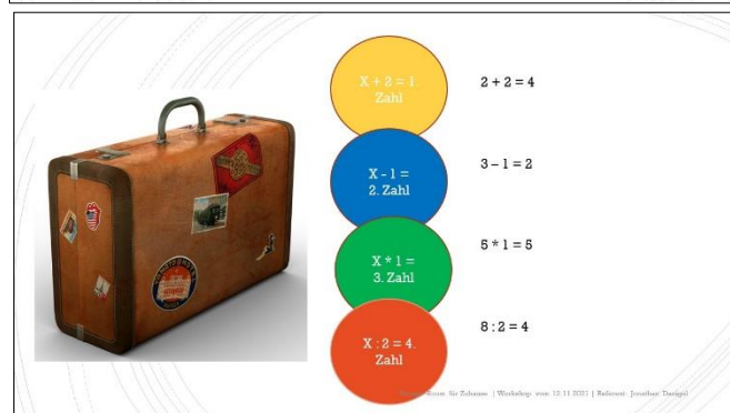
Beispielfolien aus dem Online-Kurs