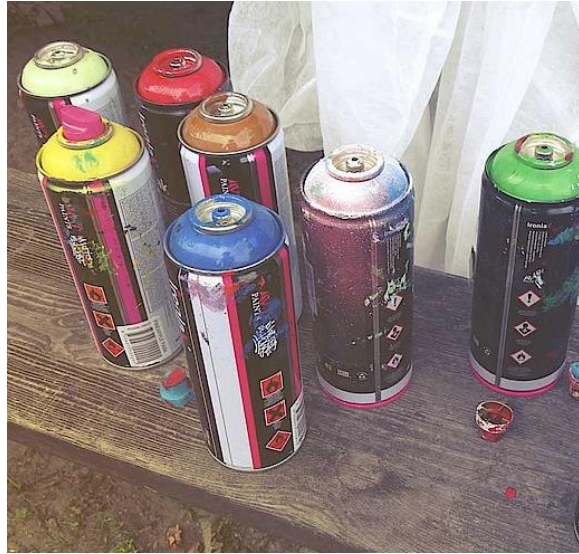
Es wird bunt beim Graffiti-Workshop.